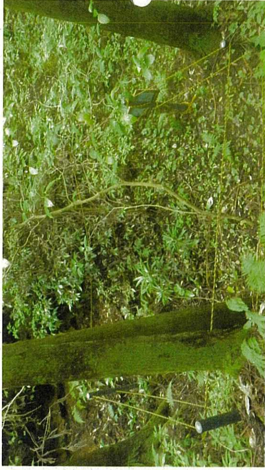
令和3年8月26日撮影 臨時点検