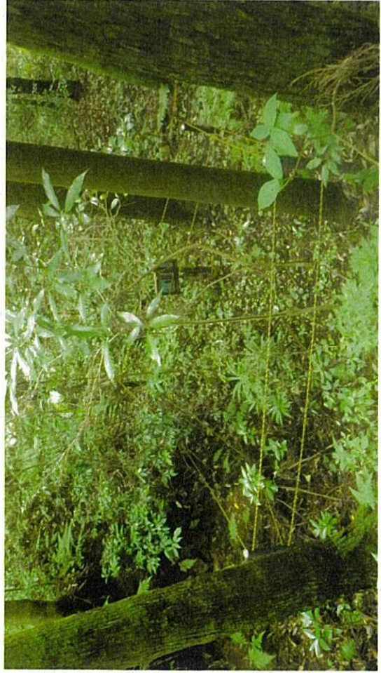
令和3年8月26日撮影 臨時点検