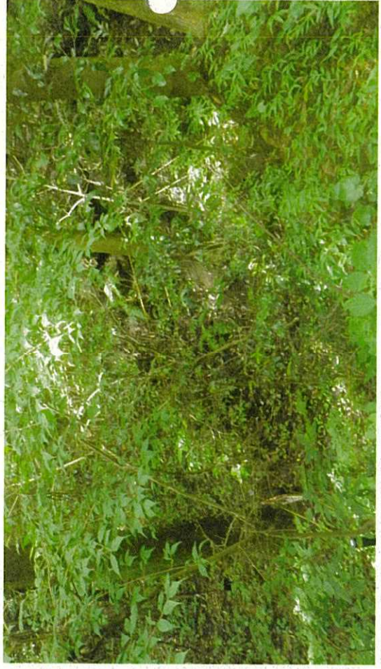
令和3年8月26日撮影 臨時点検