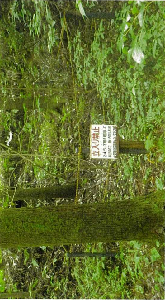
令和3年8月26日撮影 臨時点検